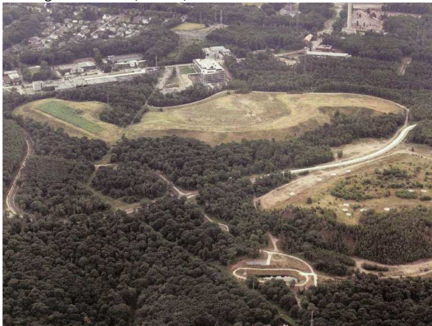
Vue aérienne du site : en haut, la rue du Bois St Jean, en bas, sur la droite, le bassin d'orage nord.

Une enquête publique s'est déroulée du 29/09/2020 au 05/10/2020 pour l'obtention d'un permis unique pour installer deux champs de panneaux photovoltaïques et trois transformateurs sur une superficie de 6,63 ha dans la zone « espace vert » au nord du parc scientifique extension Seraing, rue du Bois Saint-Jean, au bénéfice de la s.a. RESA INNOVATION & TECHNOLOGIES. La production annuelle d'énergie serait de 9,7 GWh, soit la consommation d'électricité d'environ 3100 ménages.