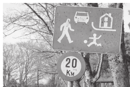
Ailleurs au Sart-Tilman