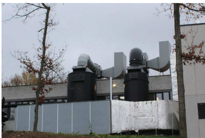
Schrubbers de la firme Bachelet

Un procès en cours contre la firme qui a installé le système d'extraction d'air empêche d'apporter des modifications pour l'instant. La société Bachelet nous a promis de nous tenir au courant de l'évolution de la situation.