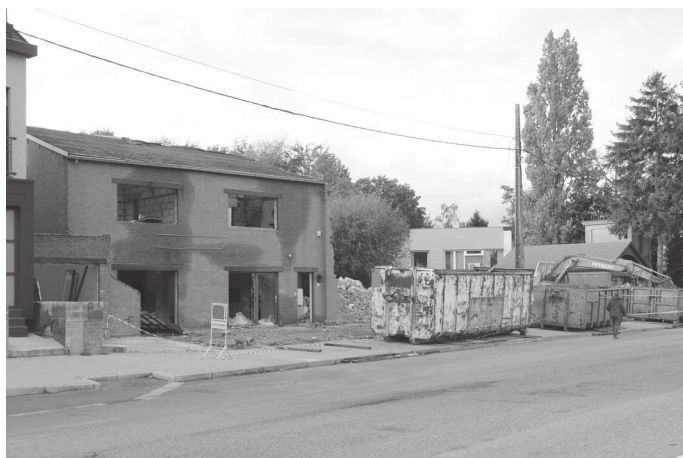
Immeuble 360A-364 en cours de démolition.

Durant l'enquête publique, 14 courriers de réclamations ont été adressés au service de l'urbanisme mais aucune réclamation n'a été prise en compte. Dans ces conditions, le 9 mars 2020, en association avec des riverains directs, le CQST a introduit un recours en annulation auprès du conseil d'État.