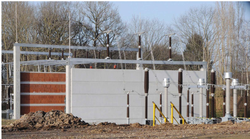
Photo de gauche : raccordement du câble à haute tension (220 kV) au pylône existant.

Photo de droite : équipements d'arrivée du câble souterrain et enceinte en U du transformateur.